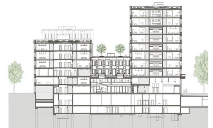
Neubau Sozialversicherungszentrum WAS, Areal Eichhof West, Kriens Architektur und Visualisierungen: Gigon/Guyer Architekten